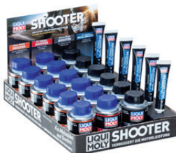
Shooter 4our/ 6ix Box N° de ref. 20406

Η τοποθέτηση των πλευρικών τμημάτων είναι πανεύκολη. Δεν χρειάζονται ούτε εργαλεία ούτε υλικά στερέωσης.