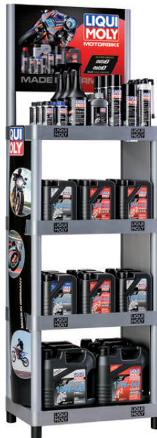
Topper motorbike per Futura Shop, N. parte 50160

Motorbike Topper για Futura-Shop, Κωδικός: 50160