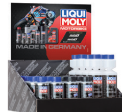
Espositore da banco Motorbike, vuoto*, N. parte 9965/9925

Motorbike προθηκη, άδειο*, Κωδικός: 9965/9925