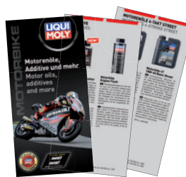
Motociclette Utenti Finali, N. parte 50255

Motorbike προθηκη, άδειο*, Κωδικός: 9965/9925