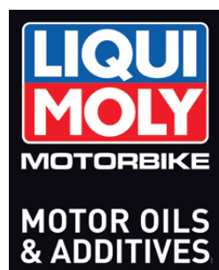
Cartellone pubblicitario Motorbike, 594 x 745 mm, N. parte 9911

Διαφημιστικός πινακας Motorbike, 594 x 745 mm, Κωδικός: 9911