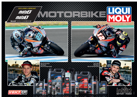
Poster Schrötter/ Lüthi DIN A1, N. parte 51335 Αφίσα Schrötter/ Lüthi DIN A1, Κωδικός: 51335